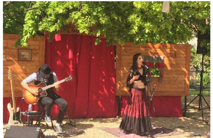
Spectacle au Festival Jazzpote (57)

Nous projetons entre les morceaux des scénettes sous forme de film d'animation, mettant en image le voyage de Ladislava.