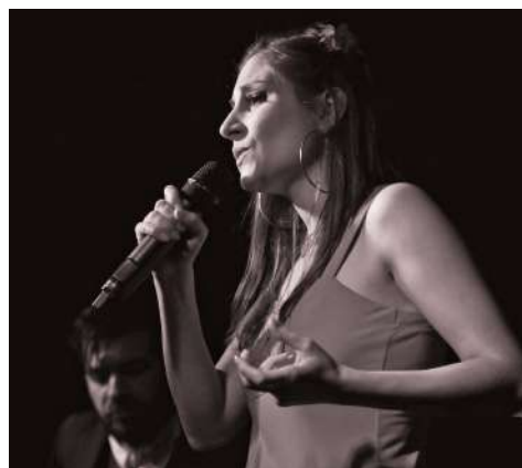
Spectacle au Festival Bohème Rhapsodie (54)

Et plus de 450 représentations en France, Allemagne et République Tchèque.