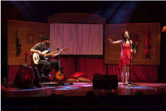
Spectacle à la Halle aux blés (88)